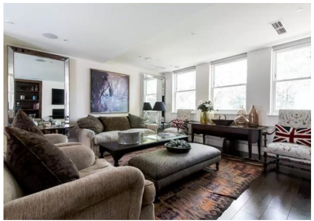
↑富裕層の高級物件を扱う民泊サービス「One Fine Stay」