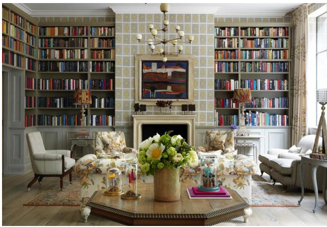
↑インテリアデザイナー・Kit Kemp がオーナーの「HAM YARD HOTEL」

日本では“民泊”ビジネスが注目されています。このビジネスを世界で初めて手掛けたのは“英国”。“B&B”の発祥地です。その英国の民泊ビジネスがさらに進化し、世界市場へ広がり、そして又新しい“民泊”が誕生し、米国へと飛び火しました。2020年には東京でオリンピックが開催されることもあり、多くの日本人がこのビジネスに関心と可能性を感じ始めています。これから世界に通用するおもてなしとその魅力について、英国に通い続ける町田ひろ子がお話しします。今大きな問題となっている空き家問題のヒントにもなっていただけることでしょう。インテリア住関連業界の方はもちろん、民泊や英国に興味のある方ならどなたでもご参加いただけます。